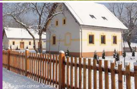
Edukativni centar "Čardak"