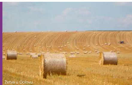
Žetva u Dolovu

Dolovo je riznica kulturne baštine sa brojnim zaštićenim spomenicima kulture i arheološkim nalazištima.