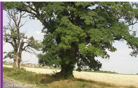
Dva bela jasena