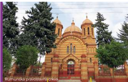
Rumunska pravoslavna crkva

Rumunska pravoslavna crkva izgrađena je 1925. godine.