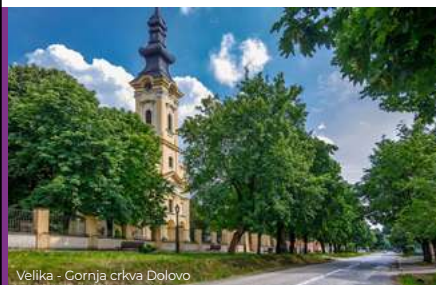
Velika - Gornja crkva Dolovo